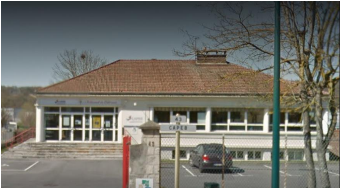
Parking (places limitées)