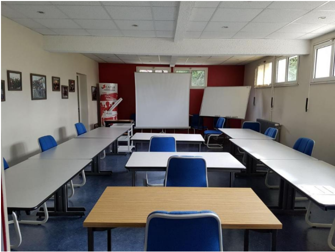
Salle de formation (15 à 20 personnes)