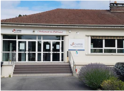
Entrée bâtiment (rampe à venir)