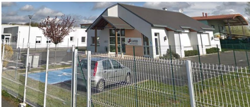
Parking (places limitées)