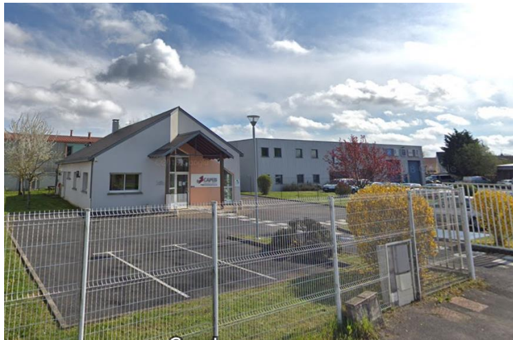
Entrée bâtiment (accessible aux personnes à mobilité réduite)