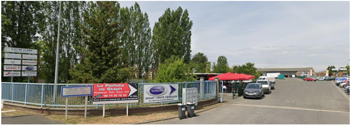
Entrée du 13 Avenue du Général de Gaulle