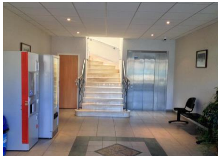
Bâtiment et Entrée (Accès au 1 er par ascenseur)